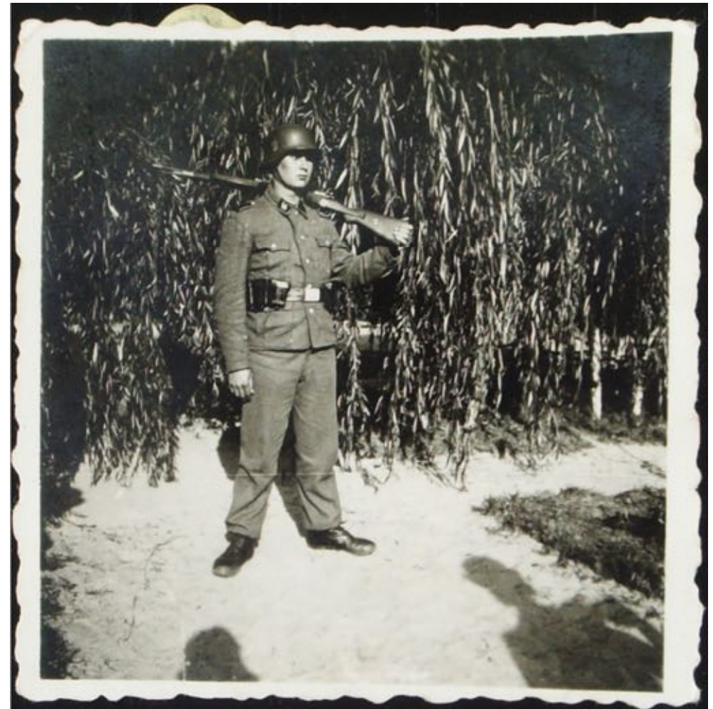
↑ Dernière affectation: 1er régiment waffen SS division Charlemagne