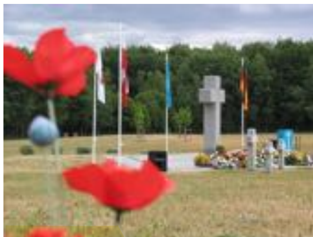
Stare Czarnowo (Polen)

Veillez tout d'abord vérifier soigneusement s'il s'agit réellement d'un membre de votre famille en contrôlant vos documents. Si vous n'en n'êtes pas sûr(e), signalez-le dans le champ de texte de ce formulaire.