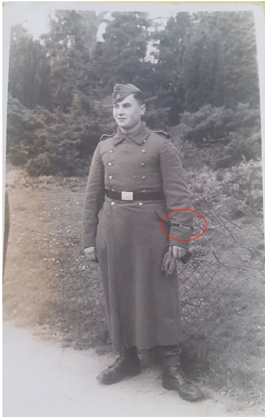
← Première affectation?: Regiment SS infanterie Germania du Verfügungs-Division